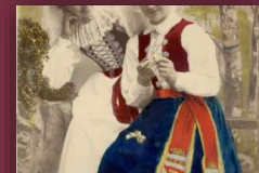
Fashion Clothing, accessories and designs