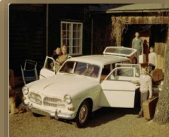
Migration Migration stories to, from and within Europe