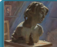
Art Inspiring art, artists and stories