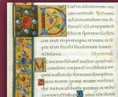
Manuscripts From antiquity to the early print era