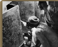
Archaeology Archaeological treasures