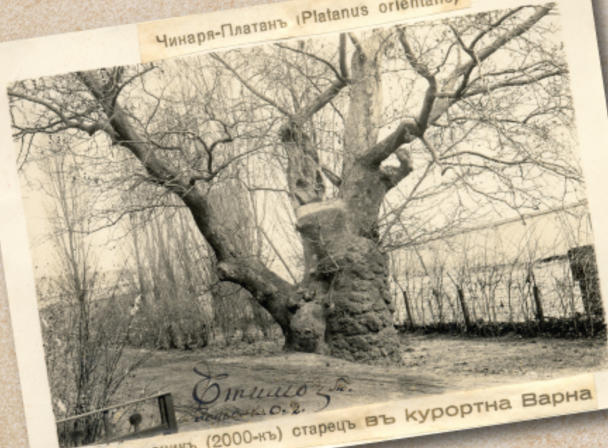
Етимова Две хилядникъ (2000-къ) старецъ въ курортна Варна