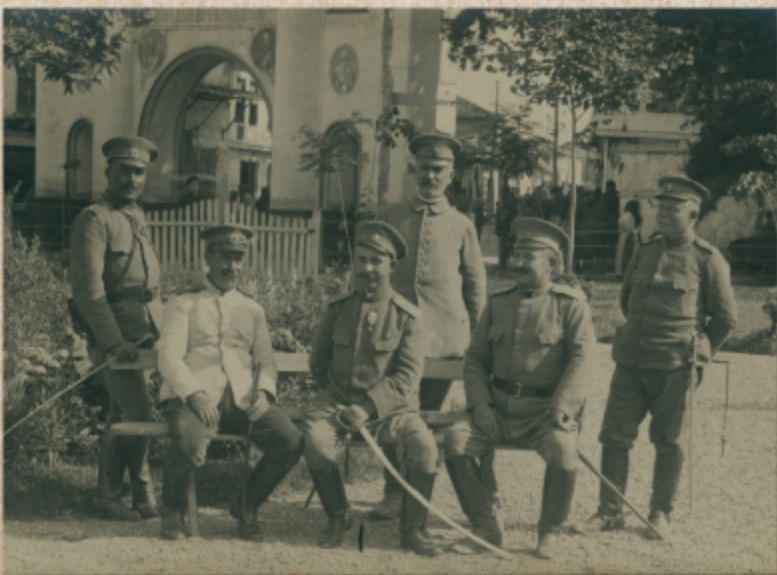
Наборната комисия в Охрид. Декември, 1916